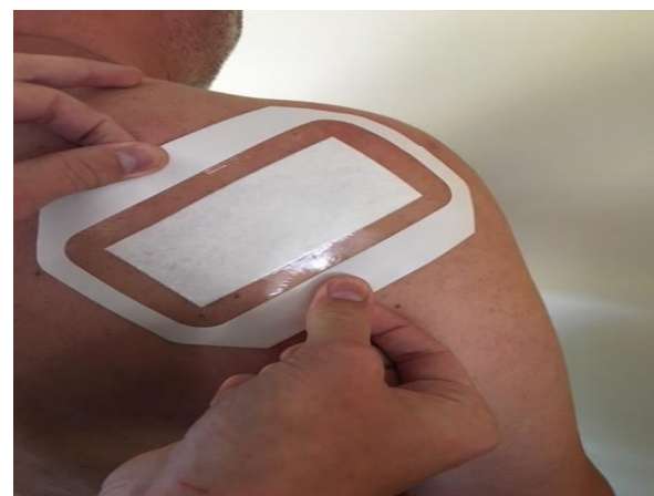
Stap 4: Plak de pleister op de wond.