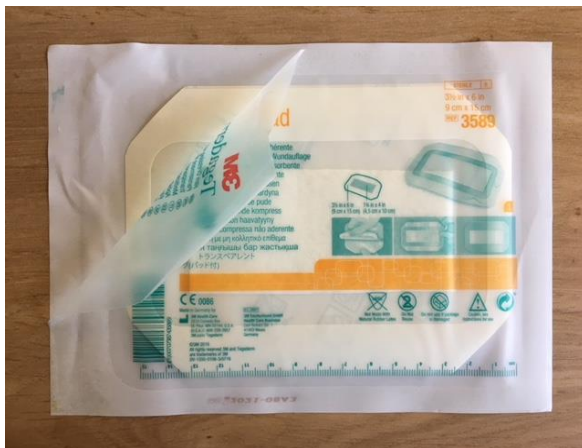
Stap 1: Haal de douchepleister uit de verpakking bij de aangegeven pijl.