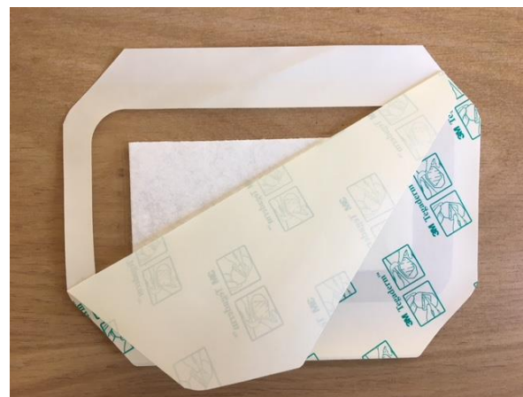
Stap 2: Haal de achterzijde van de douchepleister eraf.